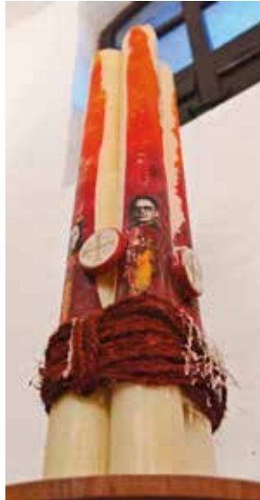
Die Kerze für die vier Lübecker Märtyrer ...