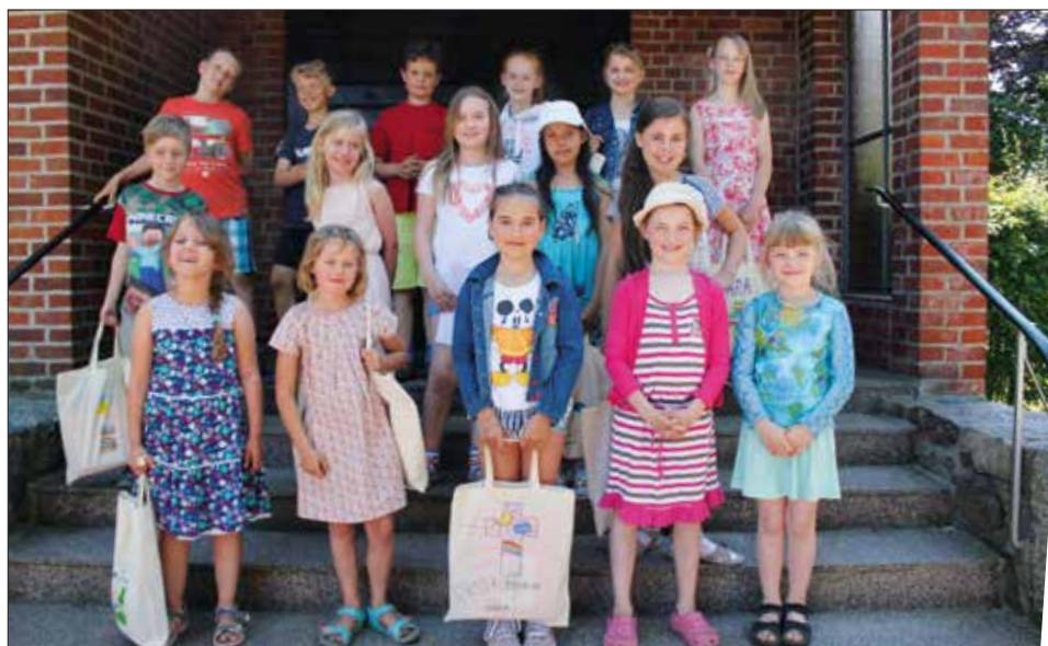
Die Erstkommunionkinder aus Bordesholm und Flintbek – wegen des Redaktions- schlusses schon vor der Erstkommunionfeier fotografiert.