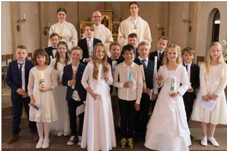
Ein schönes Fest – Erstkommunion 2018 in St. Maria-St. Vicelin, Neumünster