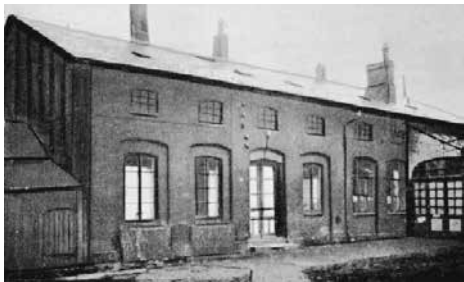
Bescheidene Anfänge ...

Am Palmsonntag, dem 20. März 2016, blicken wir in Neumünster auf 150 Jahre katholische Gemeinde zurück. Am Palmsonntag 1866 feierte eine kleine Gruppe Katholiken in Neumünster den ersten katholischen Gottesdienst nach der Reformation. Danach entfaltete sich durch die vielen Jahrzehnte ein vielfältiges Gemeindeleben.