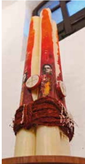
Die Kerze für die vier Lübecker Märtyrer ...