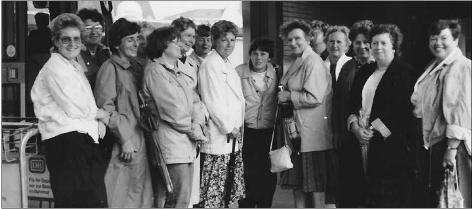
Die »Frohe Frauenrunde« macht ihrem Namen alle Ehre – damals wie heute!